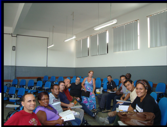
Reunião de Diretoria na ETE-HL, Niterói

fevereiro, mas até aquele dia não tido sido solucionado (!) e todas as crianças da escola ficaram sem aulas nesse período.