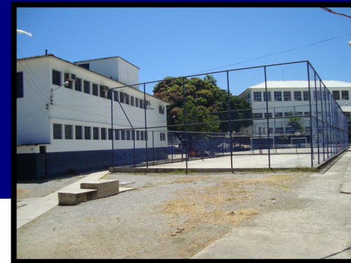
Vista da ETE-HL