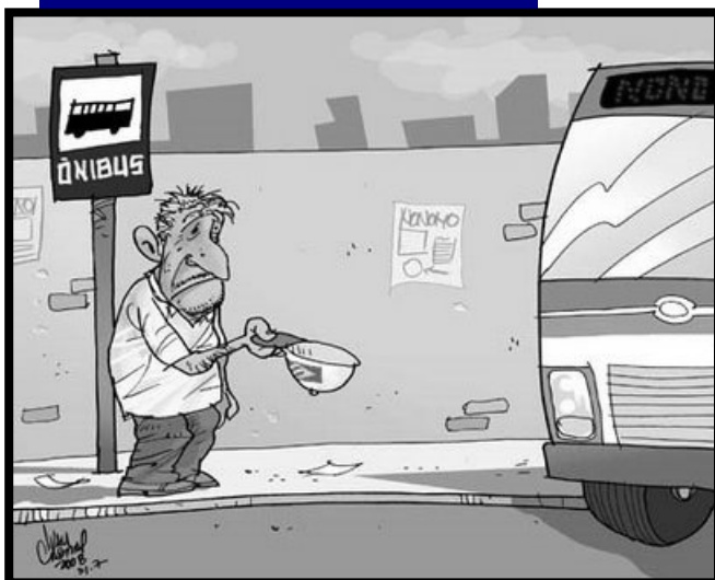
O funcionário da FAETEC lutando por seus direitos. Sem o vale-transporte, situações constrangedoras...

O SINPEFAETEC foi à Brasília lutar em prol do princípio democrático em apoio a ANDES-SN (Associação Nacional dos Docentes do Ensino Superior), que após 30 anos de existência não podiam filiar mais pessoas, devido à criação de outro sindicato apoiado pela Central Sindical CUT tirando o direito de escolha da categoria de optar pelo sindicato que ia representá-la. No início do ato o Ministro do Trabalho Carlos Lupi subiu no carro de som para fazer uma fala de retratação e agendou uma audiência para solucionar o problema. Disse que se tratava de um erro de redação na cláusula da carta sindical redigido pela sua própria secretaria. Vale ressaltar que estiveram três diretores do SINDPEFAETEC (Flávio, Natalina e Luizão), com a passagem e ajuda de custo que a própria ANDES-SN concedeu.