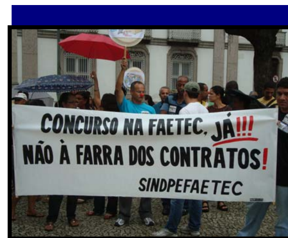
Categoria na LUTA!

carências de pessoal da rede. Já no início do ano que vem vamos pressionar para que a FAETEC convoque um número maior de aprovados para compor o quadro permanente da instituição, o que garantirá mais direitos aos novos servidores e dará maior solidez aos objetivos pedagógicos da Fundação.