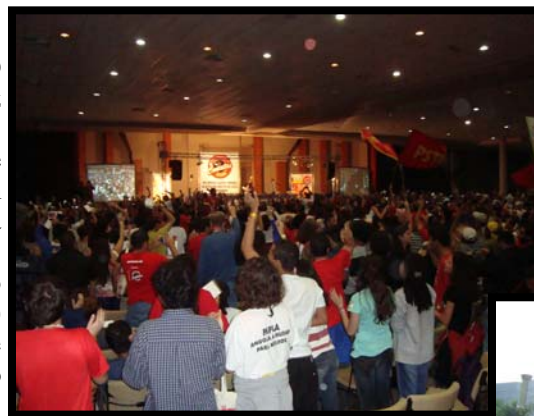
Plenária do CONCLAT - Votação

O SINDPEFAETEC acredita, apóia e atua para que as dificuldades e entraves possam todos ser resolvidos, já que o que importa é uma representação legítima da classe trabalhadora.