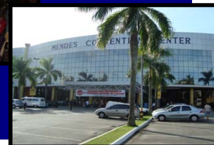
CONCLAT em Santos